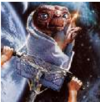
Epoca dello stupore

Questi fattori sono particolarmente importanti da utilizzare, soprattutto in un ambiente come l'attuale, che tende sempre più a spettacolarizzare i contenuti, a frammentare l'attenzione e a far disperdere le energie. E con questa situazione modificare i comportamenti diventa più complicato.