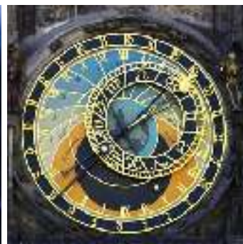
Manca di tempo